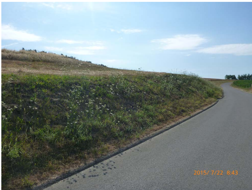
Photos de l'objet 22.07.2015